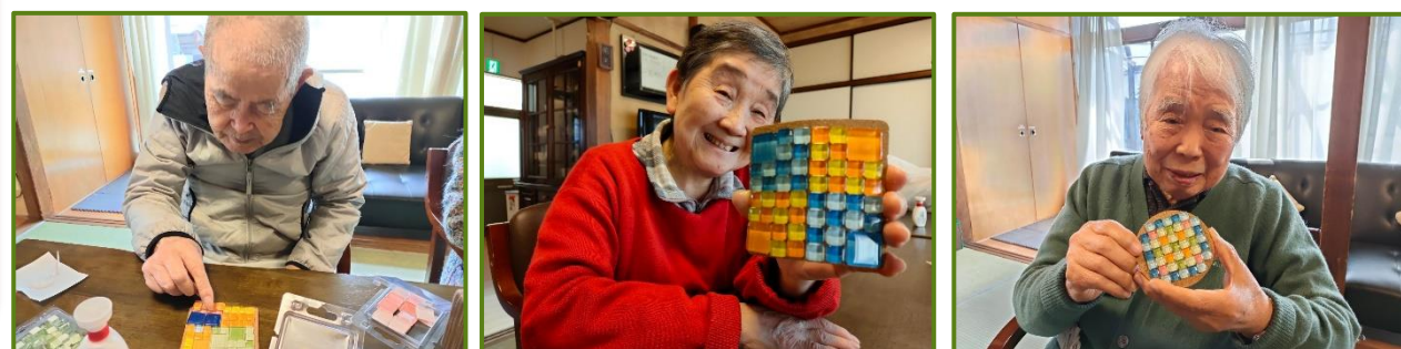
クラフトコースター作り