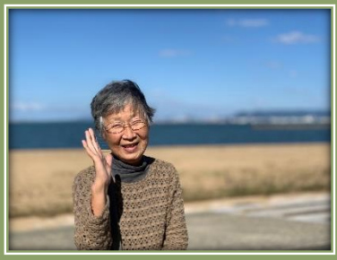
マリナタウン海浜公園