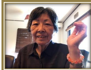
ブレスレット作り