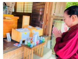
- 現人神社 -