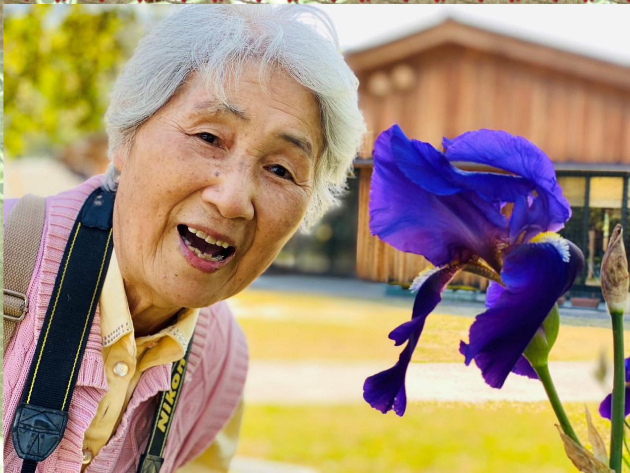
おとなりさん。南片江 主催 6月イベント