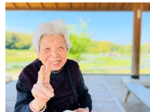
- かなたけの里 -