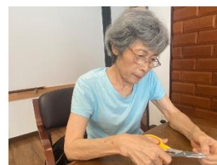
- ハロウィンの置物・魚のタペストリー -