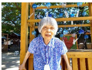
- 現人神社 -