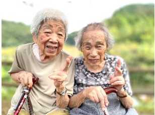
- 南畑ダム -