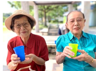
- 桧原運動公園 -