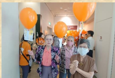
長尾病院から宝台団地まで タスキをつなぎました

RUN伴は、認知症であってもなくても、 安心して暮らせるまちづくりを 応援する活動です