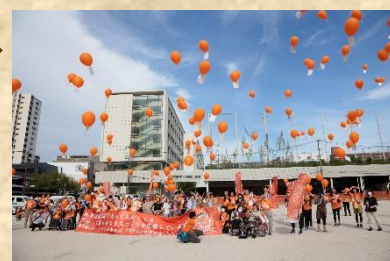
舞鶴小学校のグラウンドで バルーンリリース