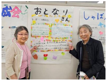
- 福岡大学の文化祭 (七隈祭) -