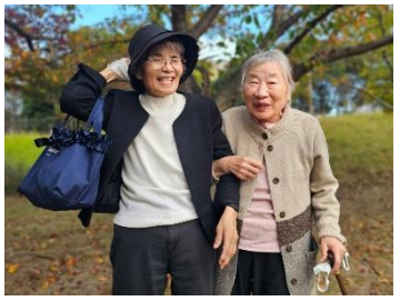
- 松原運動公園 -