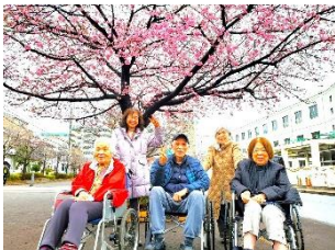
- いこいの森公園 -