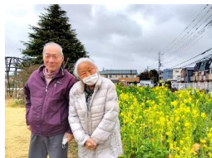
- 花と緑の広場 -