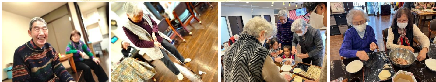
- ゴルフ大会 -

おとなりさん。ひこばえでは様々なプチイベントも開催！ 恒例の餃子パーティーも大好評でしたね！