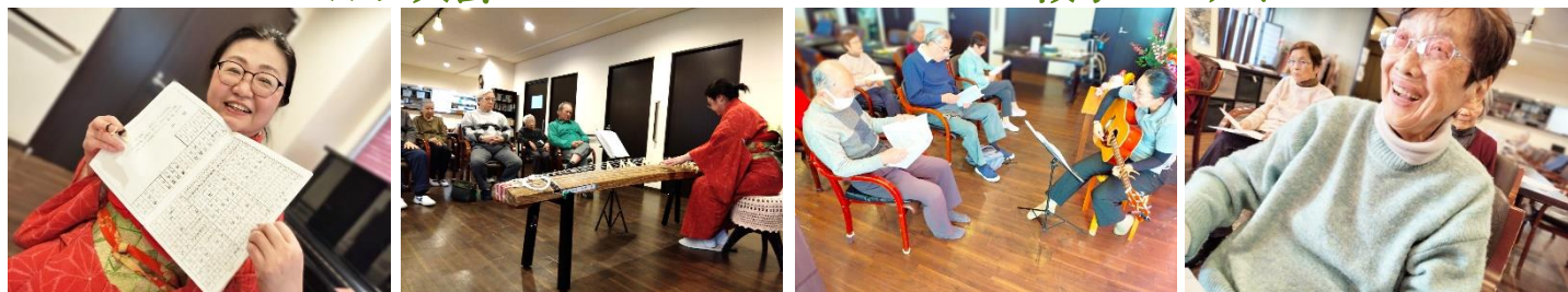
- お琴演奏会 -