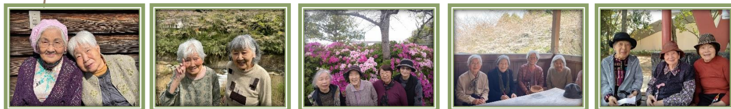
暖かくなり積極的にお出掛けする皆さん。元気に機能訓練を目的として歩いています♪