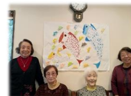
保育園の園児にプレゼントするこいのぼりの壁飾りを作りました♪鱗をたくさん貼ると綺麗なグラデーションになりました♪