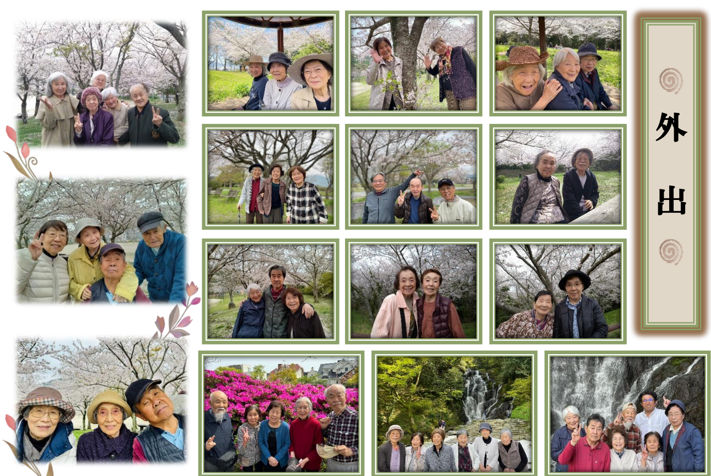
今年は記録的な暖冬の影響で桜の開花が全国的に遅れましたが、やはり満開の桜はお見事ですな♪