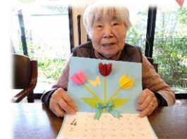
春の可愛いお花であるチューリップのカレンダーを作りました♪花びらを折って重ねて貼って立体的に♪