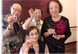
こちらは、おまけで作ったビーズストラップです。完成してすぐにバッグや小物につけていましたね♪