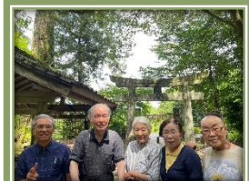
梅雨が明け、夏本番と季節が移り変わり、今年も厳しい暑さになりそうですが、体調管理に十分気を付けながら元気に機能訓練を目的として歩いています♪