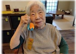
夏の風物詩のひとつである風鈴を色画用紙で作りました♪ 好きな色画用紙を選び、鈴と短冊を付けて、目と耳で『涼』を感じていただきました。