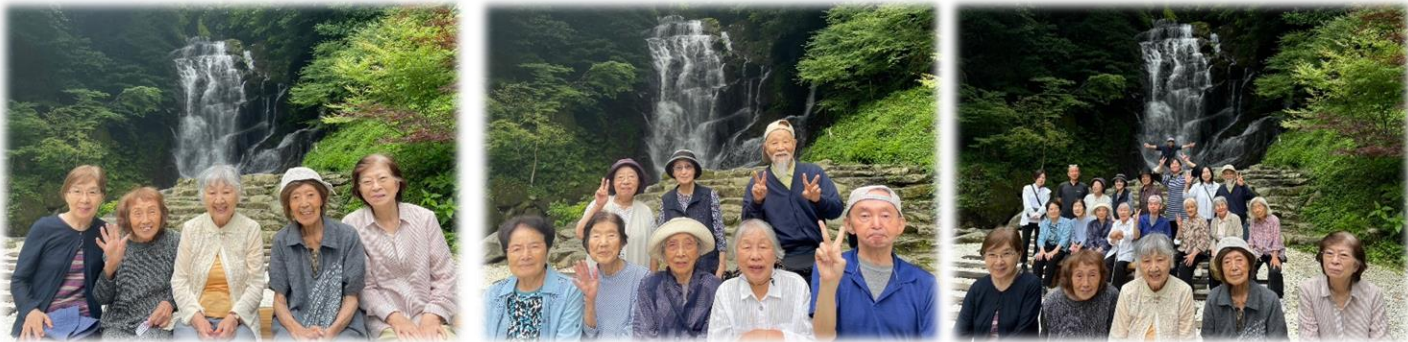
福岡県指定の名勝である、『白糸の滝』へ行ってきました♪