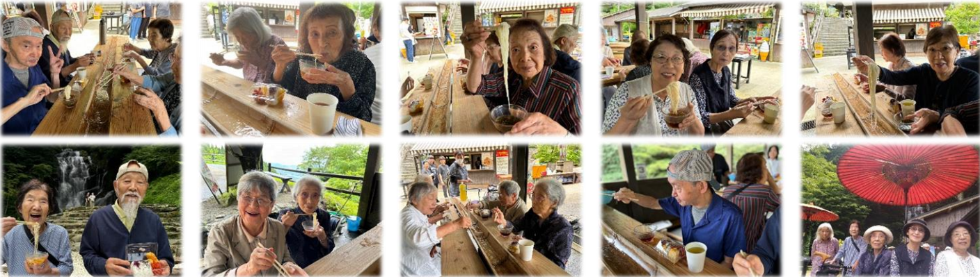
風流に涼を感じながらマイナスイオンと冷たい山水でのそうめん流しは格別でしたね♪