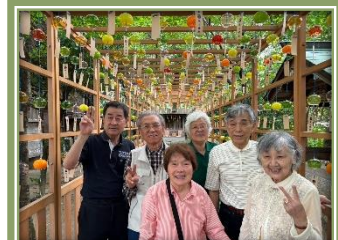
海・山・川・神社など、自然の『涼』スポットでマイナスイオンをたっぷり浴びながら散策を楽しみました♪