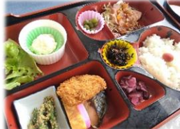
展望レストランで景色を眺めながらお食事を堪能しました♪