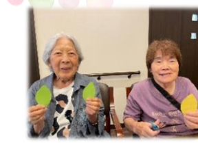
柿の飾りで秋の吊るし飾りを作りました。事業所の窓辺には、美味しそうな柿がたくさん実りましたね♪ 今年は豊作でした♪