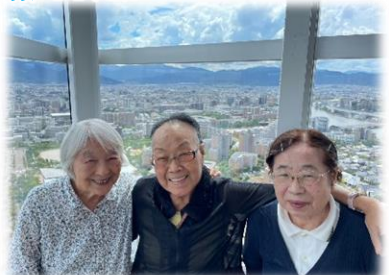
皆さんの晴れパワーで、良い天気となりました♪