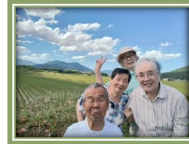
今年の記録的な残暑もようやく終わりを迎えました、まだ蒸し暑い日もあります。体調管理に十分気を付けながら元気に機能訓練を目的として歩いています♪