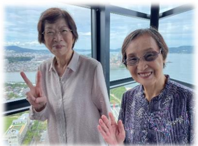
前日までは雨予報でしたが...