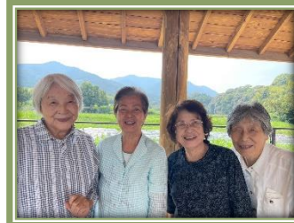
少しずつですがお出かけでも秋を感じることができました♪