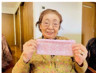
ファスナーポーチ