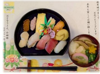
新春初売り 買い物ツアー