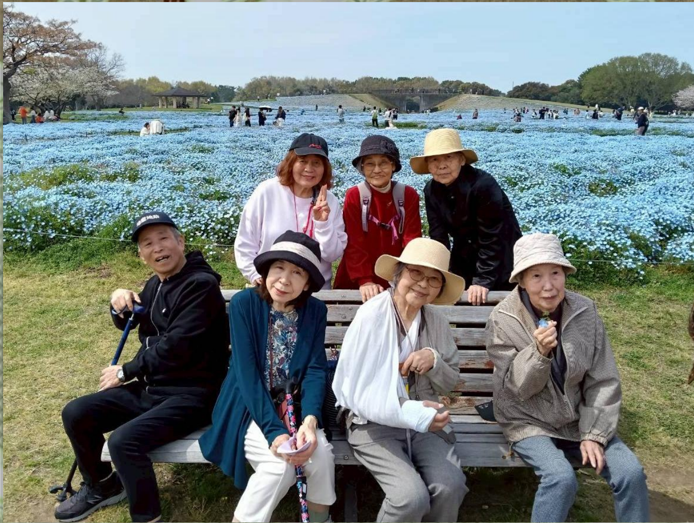
おとなりさん。南片江 主催 6月イベント