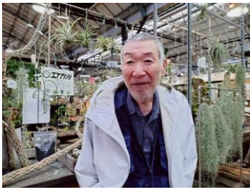
- 平田ナーセリー -