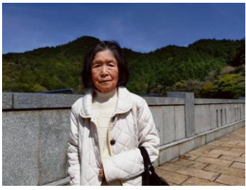
- 曲淵ダム -