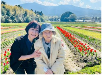
- 内野チューリップ畑 -